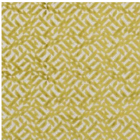
02 MOSS DUFRENE