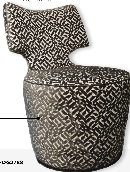
Sessel RAY DUFRENE 07 GRAPHITE