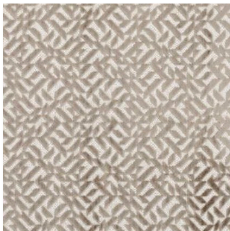
05 MOLESKIN DUFRENE