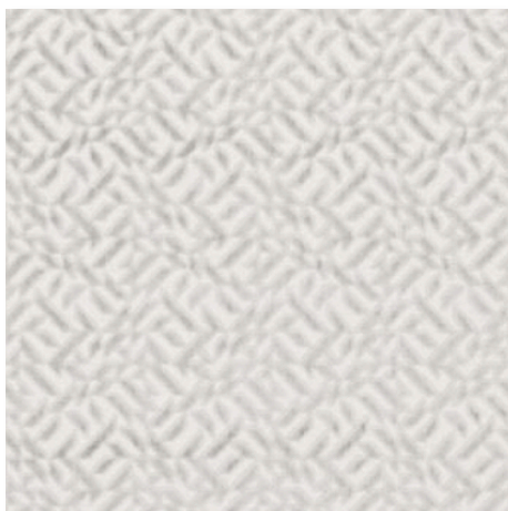
08 PLATINUM DUFRENE